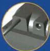
Câble noyé standard L = 380 mm