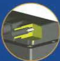
Code SPMAN Fiche Ø 4 avec manchon (profondeur 23 mm)