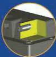
Code VIRAS Vis-tarud affleurante (profondeur 18 mm)