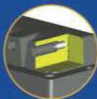
Code SP Fiche Ø 4 excentrique (profondeur 21,5 mm)