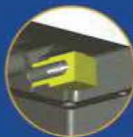
Code VIMAN Vis-tarud avec manchon (profondeur 25 mm)