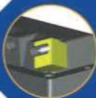
Code SPRAS Fiche affleurante Ø 4 (profondeur 13,5 mm)