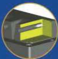
Code SPRO Trou Ø 6 Fiche Ø 4 pour câble Ø 5,2 (pro- fondeur 35 mm)