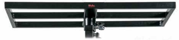
Plateforme 80 x 40cm CLI04461 (option)