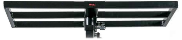
Plateforme 80 x 40cm CLI04461 (option)